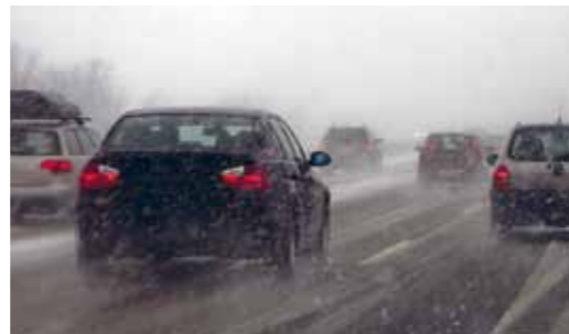
Suolausmenetelmä valitaan sään mukaan.

Pakkasliukkailla (lämpötila alle -7^{\circ}\text{C} ) suolauksella torjutaan tien liukkautta. Menetelmä sopii vilkkaasti liikennöidyille teille. Onnistuessaan toimenpide parantaa pitoa merkittävästi, mutta vaatii tilanteen kehittymisen tiukkaa seurainta. Kokemus on valttia.